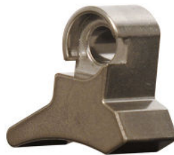
Industrie mécanique Mechanical industry