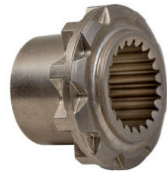
Industrie automobile Car sector industry