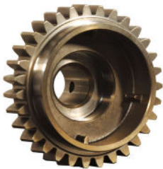
Équipement Agricole Agriculture equipment

Since 1993, Porite Europe, which is headquartered in Boudoufle on the A6 motorway, 35 km in the south of Paris, has acted as the operational interface to our site in Chunan in Taiwan as well as to our Yangzhou site in China. With its outstanding expertise in the automotive sector (80% of our turnover), the Porite Europe team can assist and support you from the commercial and technical development phase through to logistics chain control (storage capacity for 1,400 pallets) and the management of quality procedures.